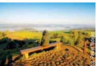
Suwalski Park Krajobrazowy