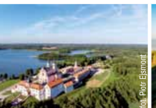
Wigierski Park Narodowy