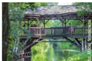
Białowieski Park Narodowy

O działalności Podlaskiej Regionalnej Organizacji Turystycznej na www.podlaskie.it