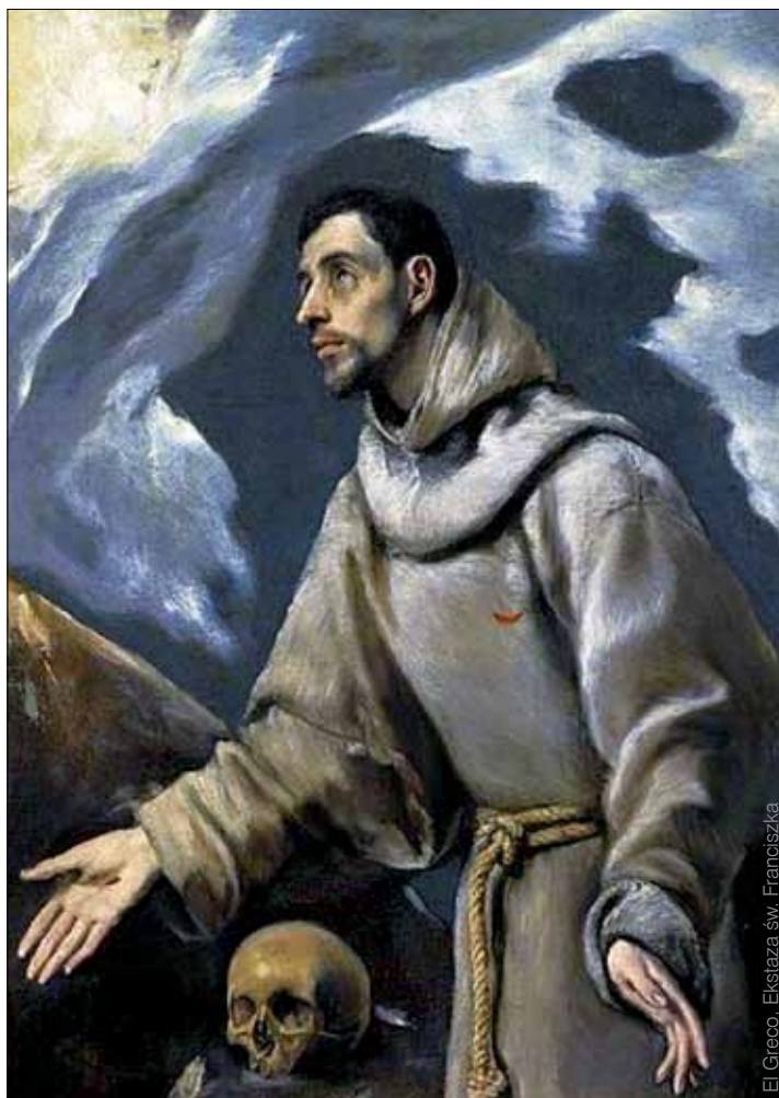
El Greco, „Ekskiza św. Franciszka”

tryptyk ukazuje wizję dnia sądu ostatecznego opisanego w Apokalipsie św. Jana. Centralną postacią jest Chrystus w roli sędziego zasiadający na tęczy, ze stopami na złotej kuli (symbol wszechświata), otoczony apostołami. Odziany w złotą zbroję Archanioł Michał oddziela potępionych, strąconych następnie w piekielną czelustwę, od błogosławionych, którzy po kryształowych schodach zdążają ku bramie raju. „Sąd Ostateczny” zamówił u Memlinga bankier z Florencji. Dzieło miało zostać przetransportowane statkiem do Italii, nigdy jednak tam nie dotarło. Na kanale La Manche wraz z całą galerią padło łupem gdańskich kaprów, którzy ofiarowali je Bazylice Mariackiej. Tam zawisło na filarze koło kaplicy św. Jerzego. Mimo nacisków samego papieża Gdańsk nie zwrócił dzieła prawowitym właścicielom. Jego późniejsze losy były ▶