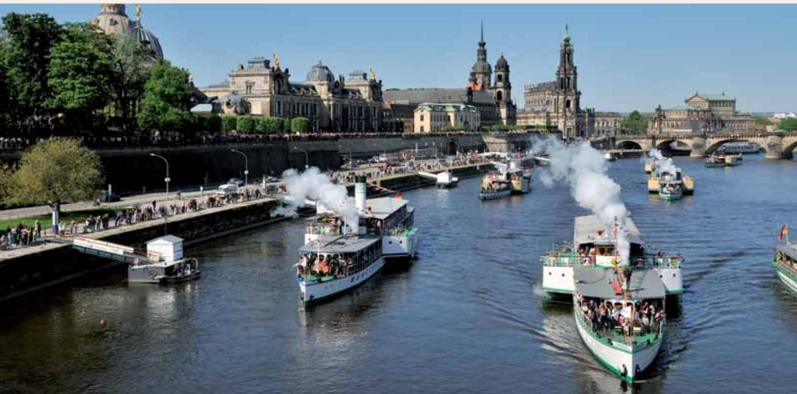
Drezno. Widok na starówkę i parostatki.