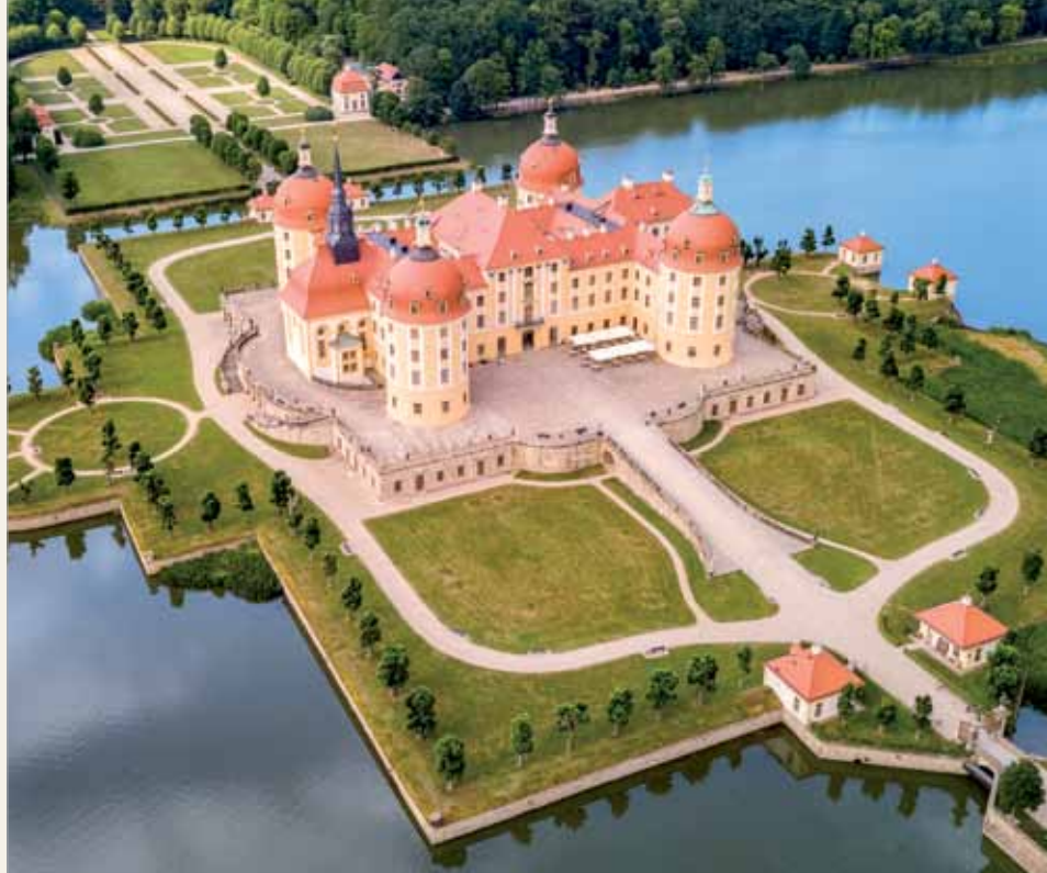
Pałac Moritzburg.