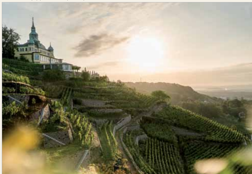
Winnice w Radebeul.

Volkswagena, gdzie wytwarzane są auta o napędzie elektrycznym oraz oferowane są programy zwiedzania odsłaniające tajniki produkcji samochodów elektrycznych.