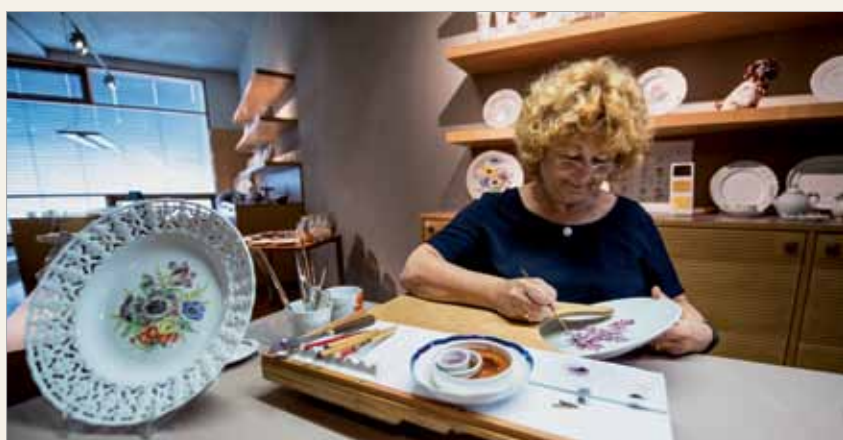
Miśnia. Pokaz zdobienia porcelany.