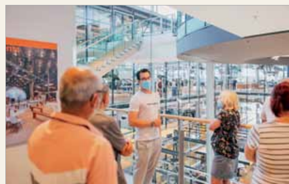
Orowadzanie po Szklanej Manufakturze VW.

Leżący nieopodal granicy z Polską region Drezno i Kraina Łaby (Dresden Elbland) to jedna z najpopularniejszych destynacji Saksonii. Różnorodnością atrakcji przyciąga turystów o każdej porze roku.