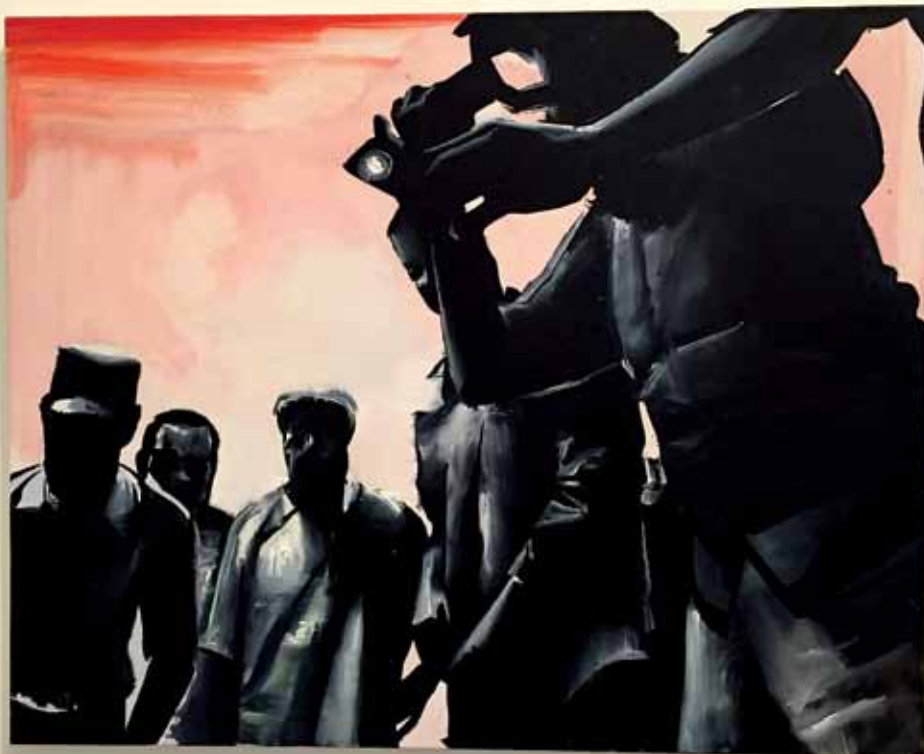
Wilhelm Sasnal - Tate Modern London

Dzieła współczesnych artystów będzie można podziwiać również w Warszawie. Od 17 czerwca w Muzeum Polin prezentowane są prace Wilhema Sasnala, który uważany jest za jednego z najwybitniejszych polskich twórców. Od 17 czerwca do 10 stycznia przyszle-